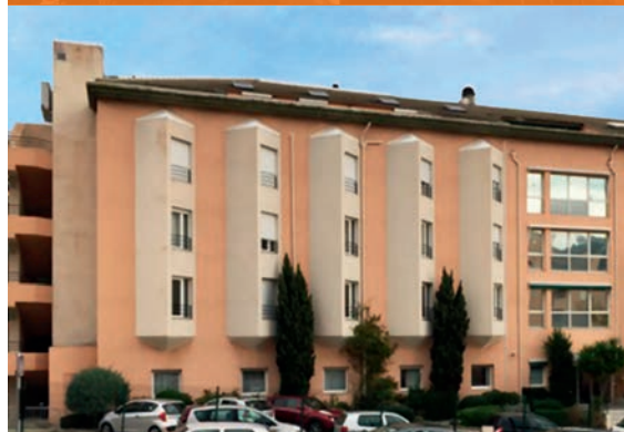
EHPAD Alzheimer - Bastia*

*Investissements déjà réalisés qui ne préjugent pas des investissements futurs.